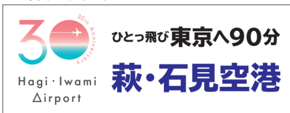
マグネットデザインイメージ