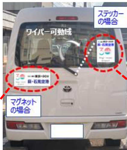
ステッカーデザインイメージ