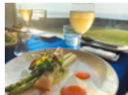
ボンスママン ノブ