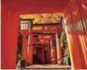
▲津和野・太皷谷稲成神社：日本五大稲荷のひとつ。朱塗りの参道が美しい。