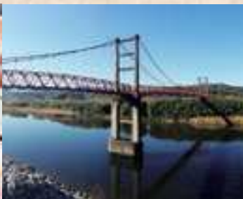
▲高津川：吉賀町から益田市へ注ぐ。一級河川で唯一、支流を含めてダムが一切無い清流。