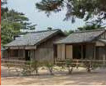
▲世界遺産・松下村塾：明治維新の原動力となる多くの逸材を輩出した。