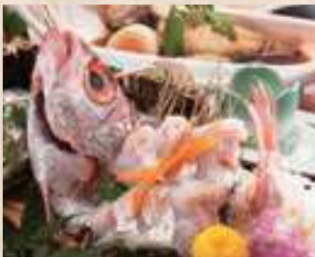
▲のどくろ：日本海の高級魚。浜田港で水揚げされるものは脂が乗りとても美味。