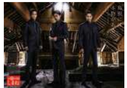
ポストカードイメージ