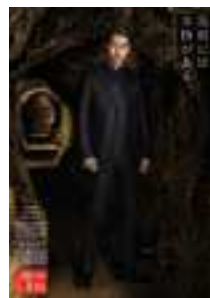
ポストカードイメージ